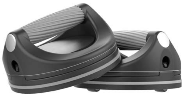
본체 제품 2개

만일, 제품 일부가 누락되었을 경우 판매점 또는 본사 02)872-8045~6으로 연락 주시기 바랍니다.